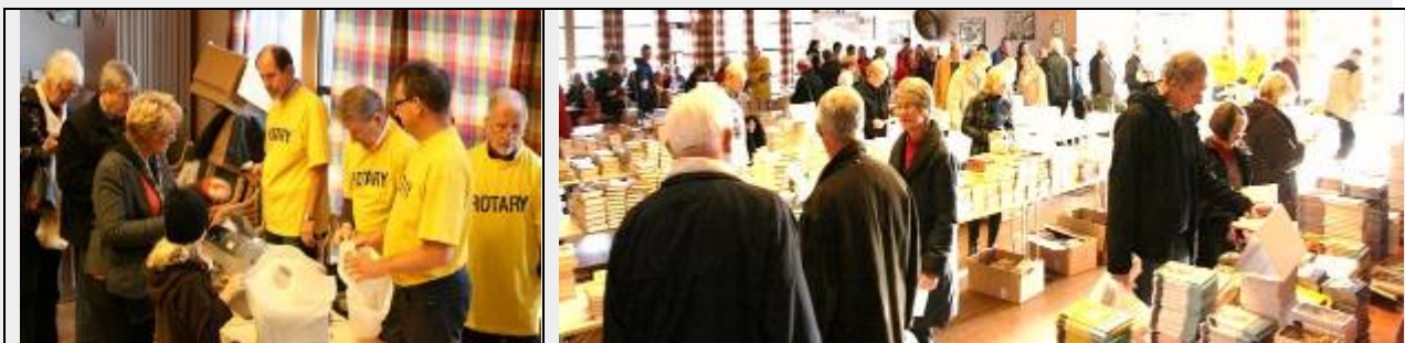
Skjeberg RK hadde bokmesse 7. og 8. november. 6 – 7 tonn bøker solgt! Se det hele på www.d2260.rotary.no