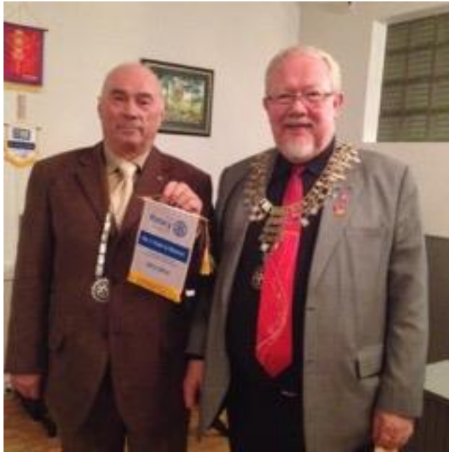
En stolt president i Kløfta Rotaryklubb har mottatt vimpel for beste klubb i Distrikt 2260.

Hva har så dette å bety for oss? Bidrag til Annual Fund er grunnlaget for det vi får tilbake fra TRF. 3 år etter det året pengene innbetales, fordeles midlene med 50% til verdensfondet WF og 50% til distriktenes fond DDF. DDF er det distriktet som disponerer og i år har vi fått nesten 50.000 $. Imidlertid er bidragene fra klubbene avtagende og på bakgrunn av innbetalingene i 2013-2014 vil vi i 2016-2017 ikke få mer enn i underkant av 35.000 $.