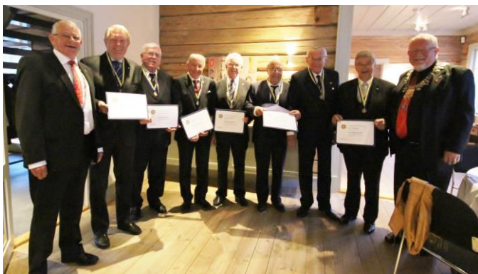
Chartermedlemmene fikk hver sin PHF