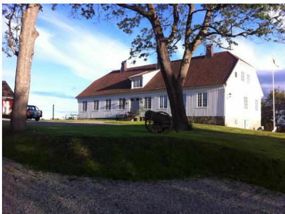
Tune gamle prestegård