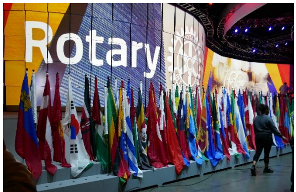
Flagg var oppstilt på to steder, her er halvparten.