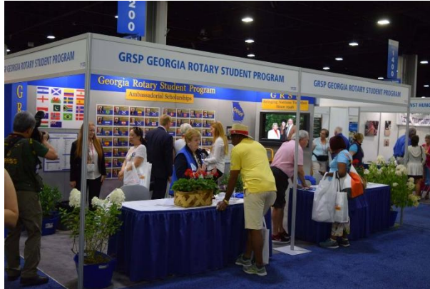
Georgia stipend, som også Norge sender flere ungdommer på, hadde egen stand her.