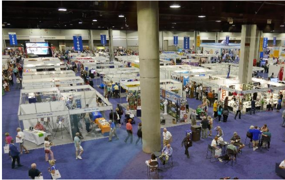
House of Friendship er alltid imponerende.