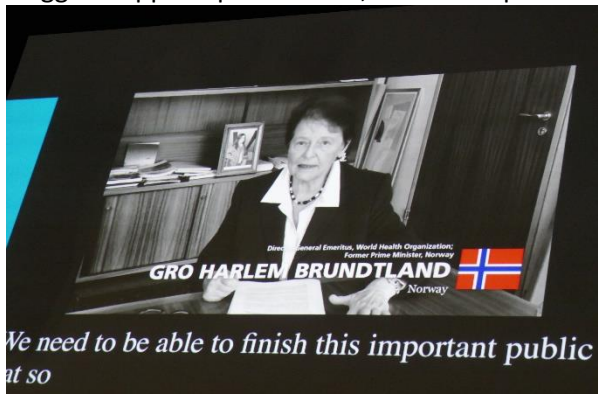
Vår tidl. statsminister og generalsekretær i WHO hadde også en appell til deltakerne.