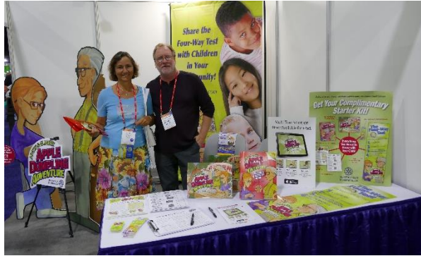
Stand med «4-way-test» mot mobbing i skolen.