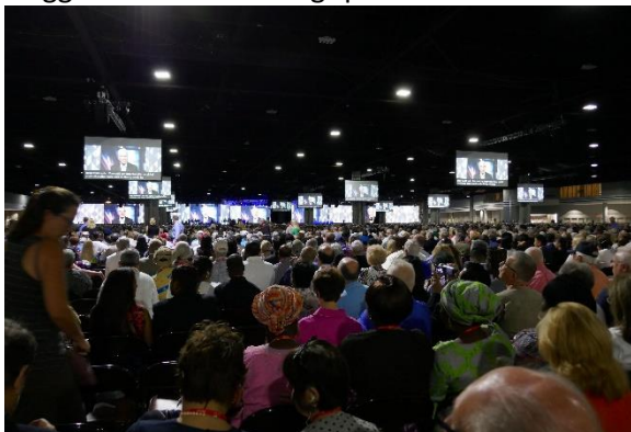
Den store salen var enorm, mange skjermer hjalp til å formidle hva som skjedde på scenen.