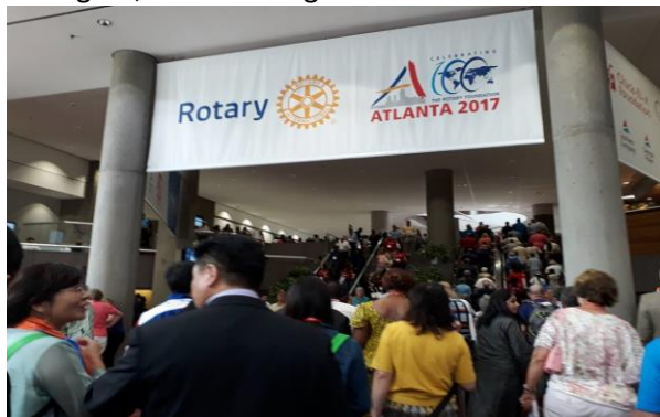
Georgia World Congress Center fyller seg med rotarianere fra hele verden.