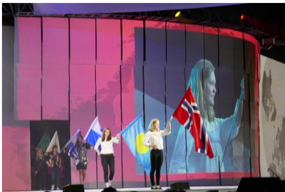
Flaggseremonien er en gripende affære.