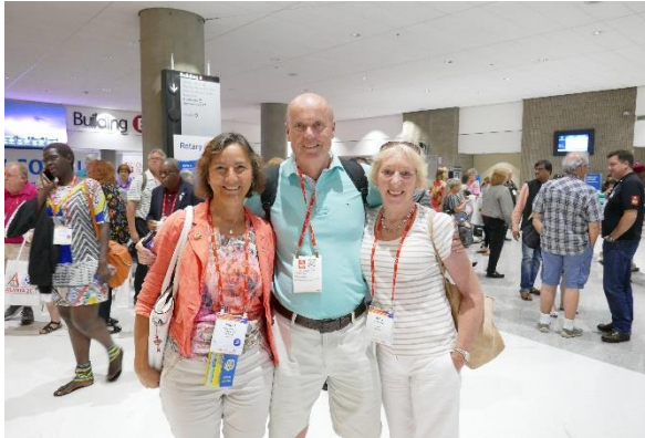
Alltid hyggelig med gjenforening med gamle kjente fra alle verdensdel, her DG, England.