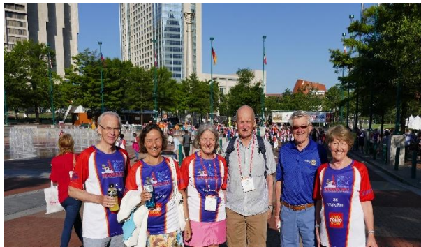
Distriktsguvernører fra tre distrikter, med ledsagere, kom i mål og ser frem til resten.