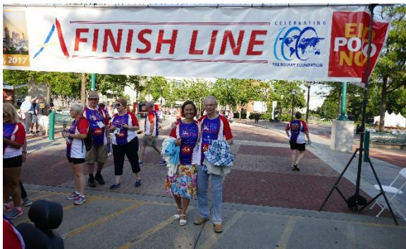
3K marsjen/løpet for End Polio Now i sentrum av Atlanta, dagen før åpningen 11. juni 2017.