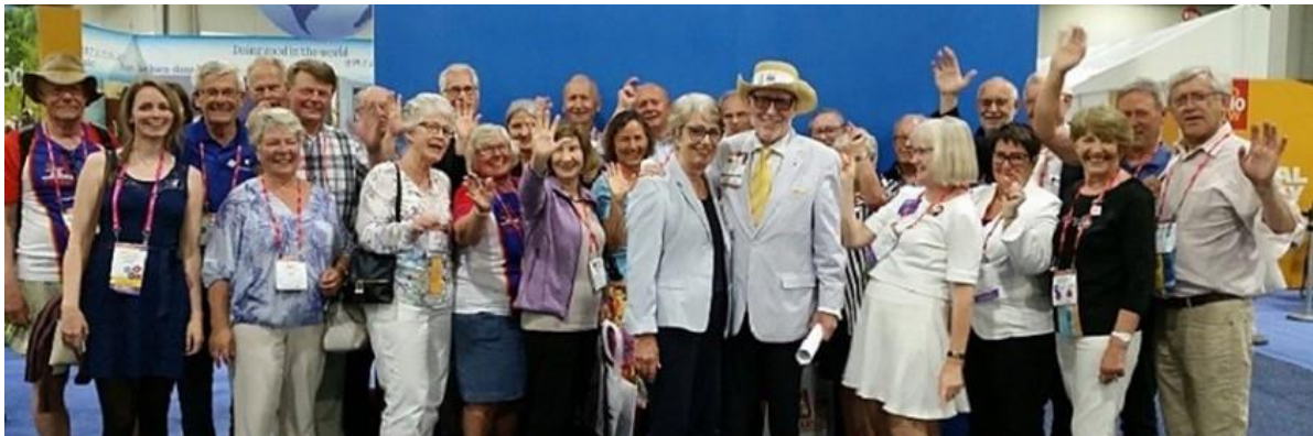
En stor gjeng fra Norge vinker farvel og gleder seg til neste Convention i Toronto. Bli med du også!