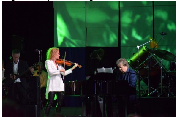
Vår kjære musiker og komponist Rolf Løvland, med Secret Garden, avsluttet hele Convention.