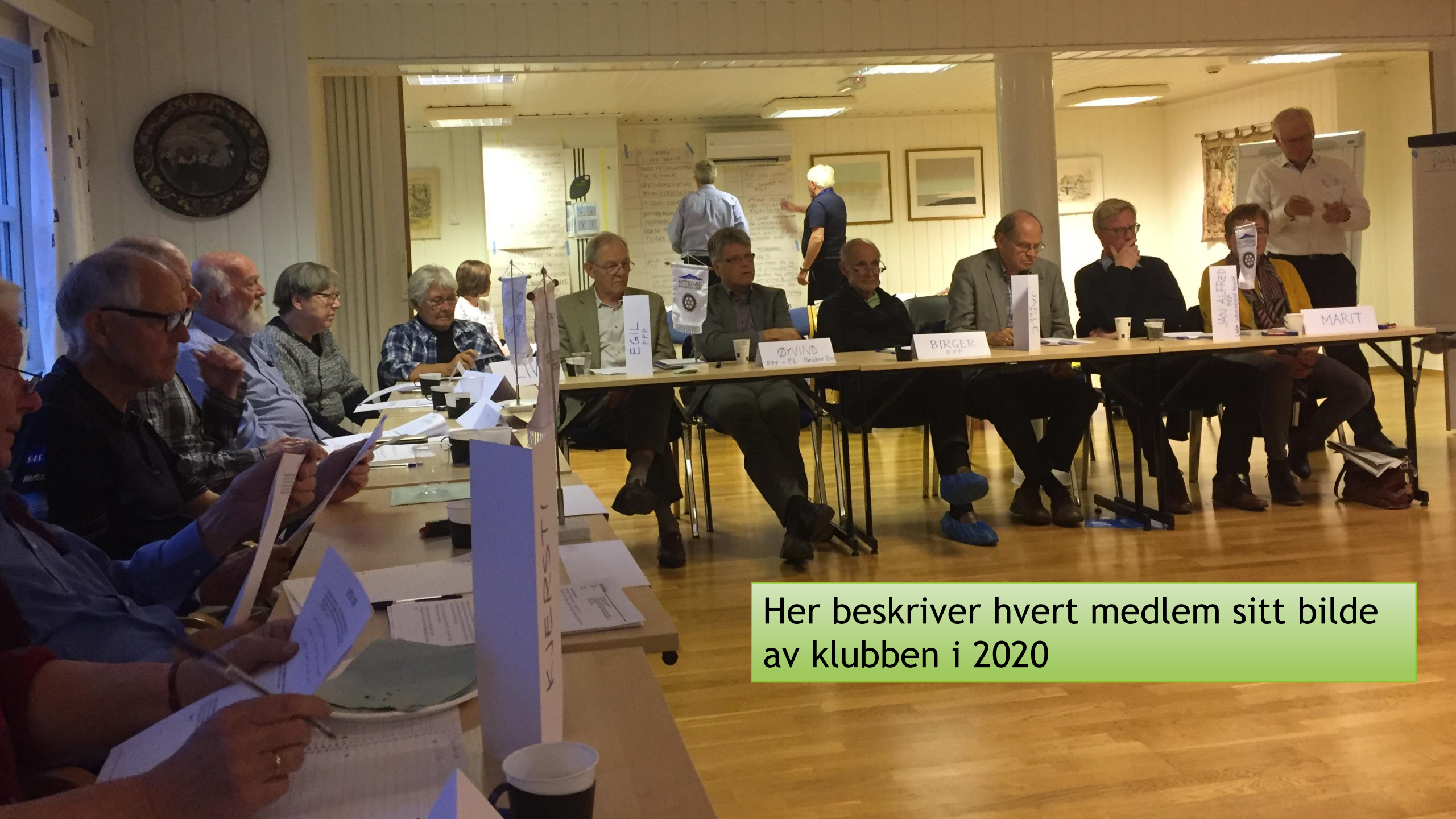
Her beskriver hvert medlem sitt bilde av klubben i 2020