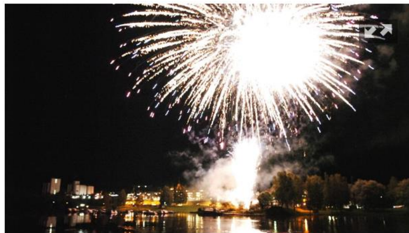
Slutt: Årets matfestival ble avsluttet med et stort fyrverkeri på Årnes brygge.

Matfestivalen har med andre ord vært en suksess, og klokka 22.00 ble festivalen avsluttet med et storslått fyrverkeri på Årnes brygge.