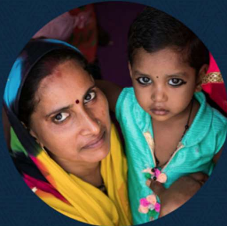
Saving Mothers & Children