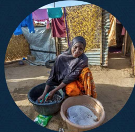
Providing Clean Water