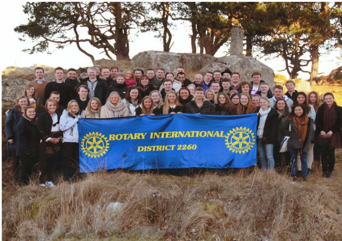
Ungdommene fra årets RYLA samlet til gruppefotografering etter avsluttet kurs