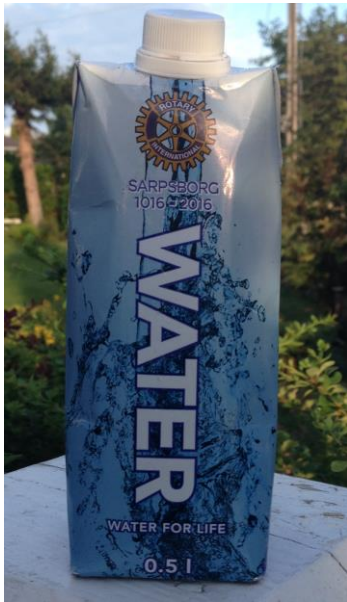
Gikk unna: Vann til inntekt for Polio Plus.