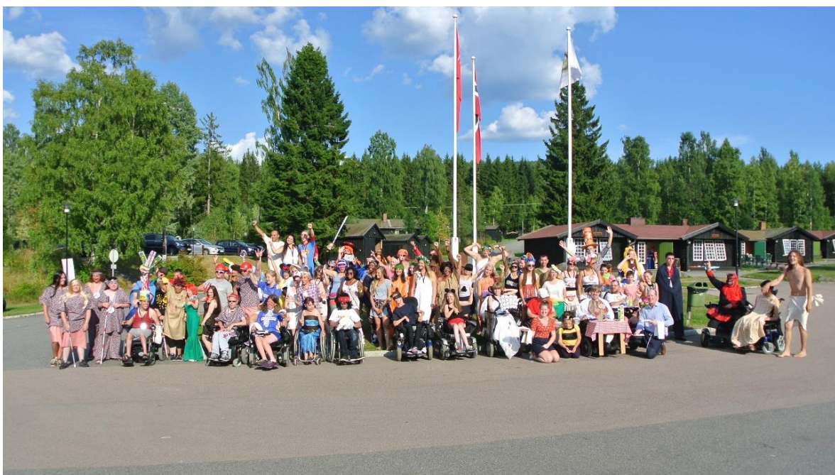
Flott arrangement: Handicamp ble arrangert for 20. gang.

I år besøkte jeg leiren to ganger, på åpningsdagen og på «Åpen Dag». Det er imponerende hva de får til. Ungdom som er lenket til rullestolen og knapt kan røre seg blir tatt med på vannski, ridning, seiling, go-kart kjøring, rallycross og mye mer. Integreringen av fysisk funksjonshemmede og funksjonsfriske ungdommer gjennom sport og sosiale aktiviteter synes å fungere utmerket. Mottoet for leiren er da også å «gjøre det umulige mulig».