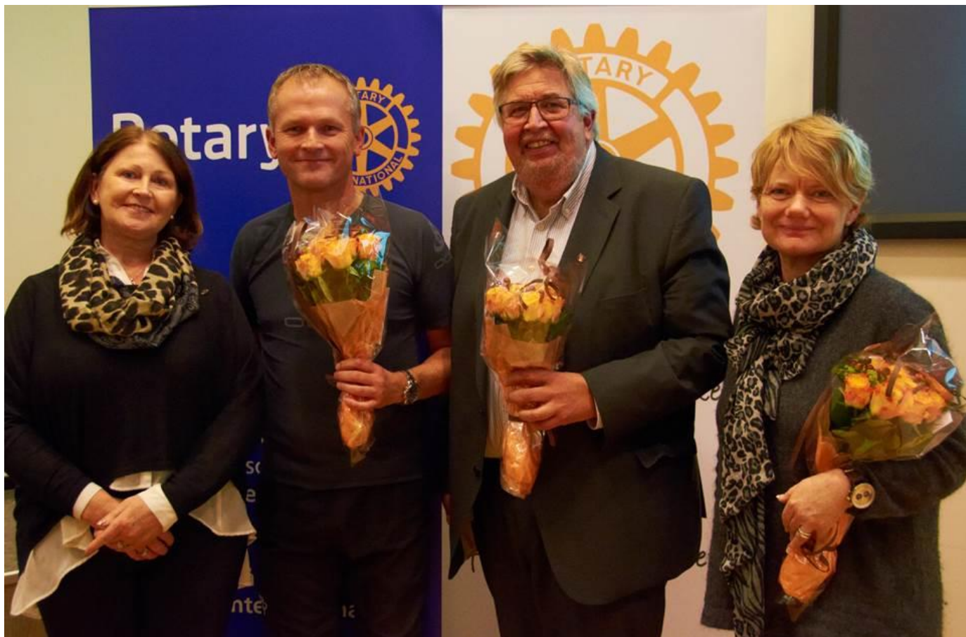
Engasjerte. Kommunereformen var tema på Intercitymøte på Høgskolen i Akershus.

Men honnør til programkomiteene i våre 2 klubber for god jobbing med tema, innledere og å skaffe godt møtelokale, og til kameratskapskomiteene som stod for kaffe, kaker og inntekter til Polio Plus. Og sist, men ikke minst, til lokalpolitikere som sporty stilte opp på kveldstid!