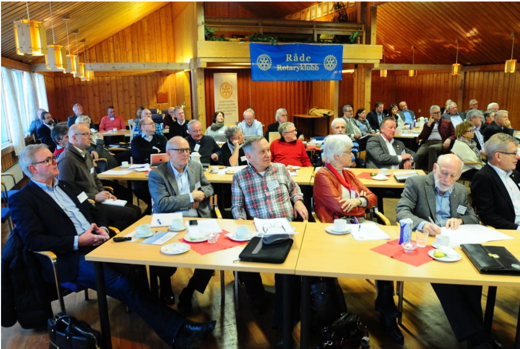
Fra midtveismøtet: De fleste klubbene var representert på møtet i Råde i januar.