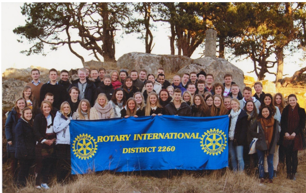
Unik lederopplæring: Deltagere fra et tidligere RYLA-seminar.