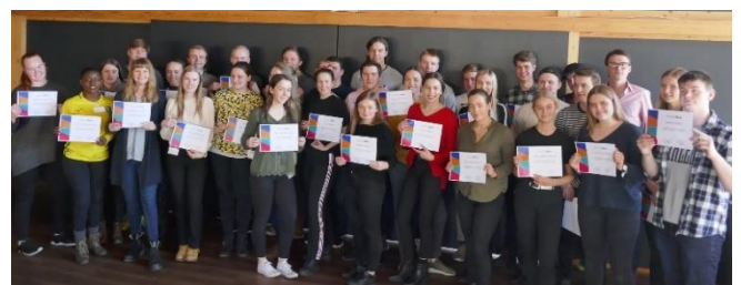
En blid gjeng mottok sine diplomer etter godt gjennomført RYLA på Oscarsborg festning og hotell 16. – 18. 3. Responsen var god og arrangørene er stolte over de