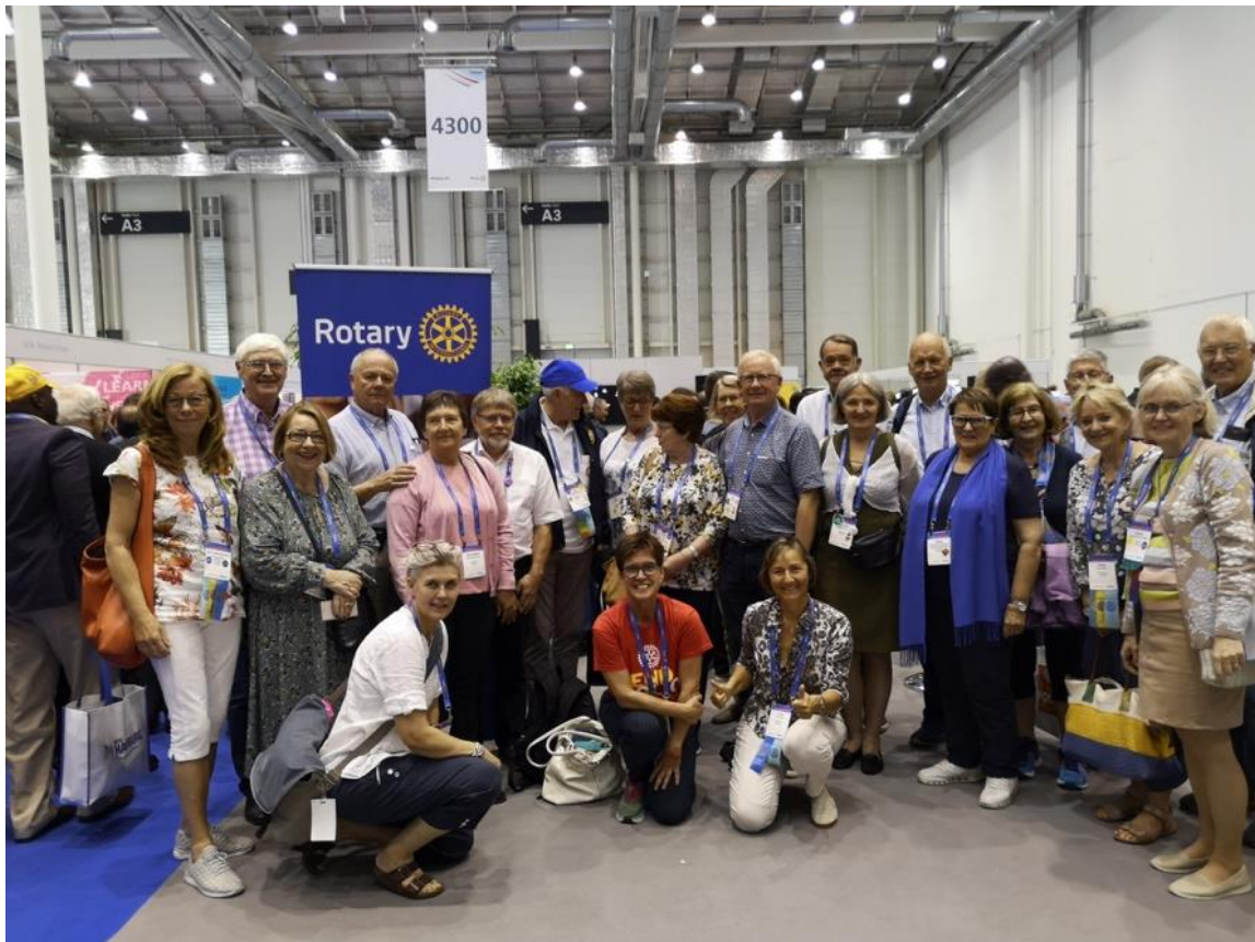
Del av den norske delegasjonen i Hamburg.

I juni reiste distriktguvernøren og mange andre fra de norske rotarydistriktene til RI Convention i Hamburg. Det var en uforglemmelig opplevelse.