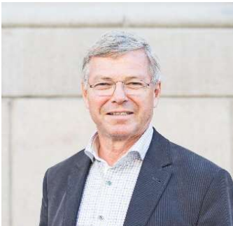
Kjell Magne Bondevik: Statsminister i to perioder (1997-2000 og 2001-2005), KrF politiker fra Molde, bosatt på Kolbotn, Molde-fan for fotballherrer og Kolbotn-fan og har vært i styret for fotballdamene. Startet Oslosenteret i 2006, en uavhengig stiftelse for å samarbeide for menneskerettigheter, demokratiutvikling og interreligiøs og interkulturell dialog. Bondevik er meget godt kvalifisert til å snakke om konferansens tema: Likeverd, toleranse og fred med sitt foredrag: 'Utfordringer fra en verden i endring'