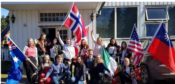
Uttevkslingsstudenter fra mange land samlet foran Rotaryhuste på Kløfta

Ungdomsutveksling gir unike opplevelser for 16-17-åringen som reiser ut, vertsfamilien som tar i mot en ungdom i sitt hjem og klubben som både sender en ung ut og mottar en fra et annet land i sin klubb.